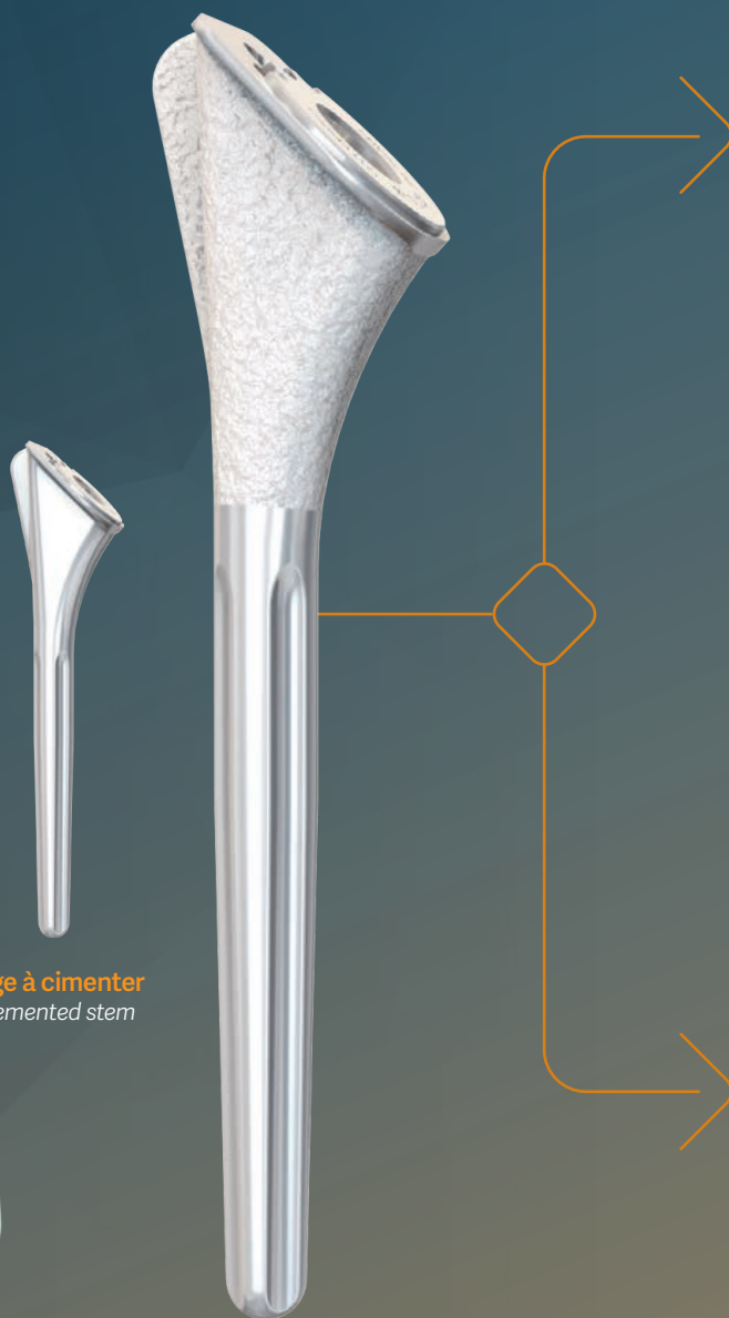
Tige à cimenter Cemented stem