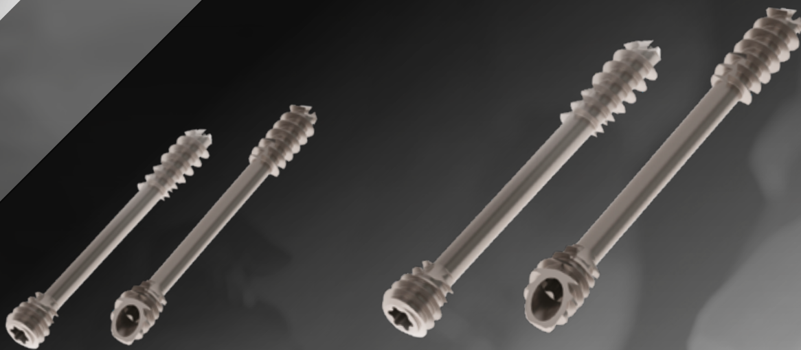
VIS MÉDIO PIED Ø4,5